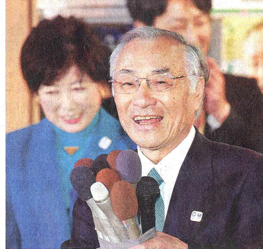
当選確実となり、支援者にあいさつする石川氏。左は小池知事(5日)

東京都千代田区 江戸城の別名「千代田城」にちなんで名付けられた。面積は11.66平方キロで、皇居や国会議事堂、東京駅、秋葉原の電気街などがある。企業のオフィスも集中する「日本の中枢」で昼間人口は約80万人に上る一方、有権者数は東京23区で最少の約4万7000人。近年は子育て世代向けの医療費助成などで、4万人を切っていた人口が約6万人まで回復した。衆院選小選挙区では「東京1区」(港、新宿区も含む)。